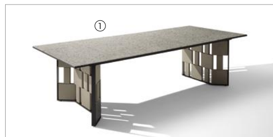
1 Break 88250 fin.3F