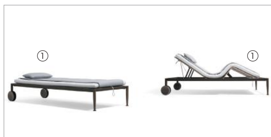
1 Gea 87060 jimmiz plain 1037 +87061 jimmiz mélange 1040