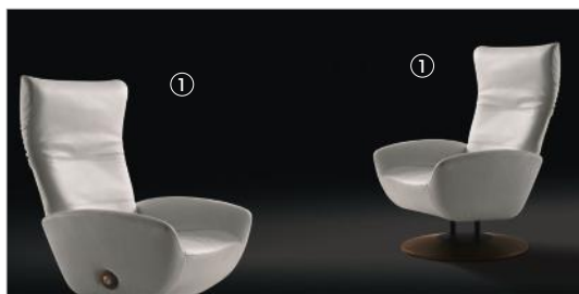
1 Magica 61500 aniline sense leather 9244 fin.11